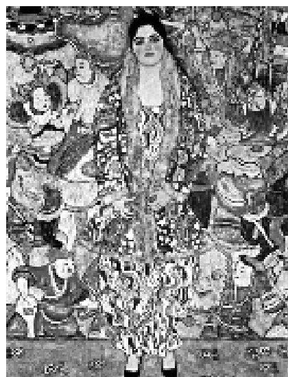
Fredericke Maria Beer

În prezent în România se critică foarte mult calitatea învățământului (la noi, pace). S-a constatat că manualul de mate românesc de-a VI-a echivalează cu manualul de mate german de-a VIII-a. Și dacă i-am arăta manualul nostru de-a V-a unui elev român de-a VI-a, să știți că nu se va descoperi într-un perimetru depășit. Și dacă suntem noi mai căpoși ca occidentalii cu două-trei clase, atunci de ce suntem atât de săraci? – pentru că inteligența noastră nu e una eficientă, autentică, bazată pe concepte reale, ci pe formule care nu au cum să creeze personalități. Or, noi suntem niște cutiuțe de memorat, niște lăzi de-nghițit biți cu nemiluita, niște 10-iști epuizați, imaturi, neexperimentați, pe care viața îi surprinde gârboviți sub povara teoriilor și dezamăgirilor în serie. Sau poate spre asta și s-a tins atâta vreme...?