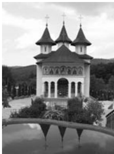
Mănăstirea Sihăstria, Târgu-Neamț