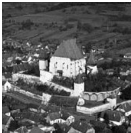
Mănăstirea Biertan, Sibiu

Și parcă trezindu-te din comă sau ca și când revenindu-ți dintr-o amnezie, ai conștientizat ceva util și necesar. Ai învățat lecția pe care șoseaua ți-a predat-o cu dezinvoltura ce-o caracterizează. Ai înțeles că nu erai mai sărac decât primul băiat și nici mai bogat ca cel de-al doilea, așa precum niciunul dintre cei doi nu era întruchiparea fie a bogăției, fie a sărăciei. Ți-ai dat seama că viața trebuie prețuită și că nimic nu-i mai presus de ea. Oricum, viața e pentru a fi trăită, nu batjocorită sau deplânsă printr-o existență. (...)